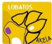
Huella de Akela