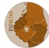
Etapa de Animación