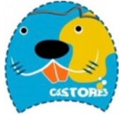
Castor sin paletas