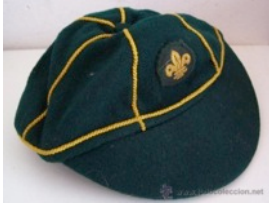
Casquete de Lobatos

Se puede llevar gorra, el tradicional casquete de Lobatos o sombrero scout