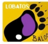
Huella de Baloo