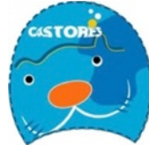
Castor con paletas