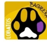
Huella de Bagera