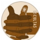
Etapa de Integración